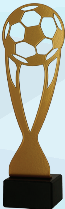
ML - SOC1