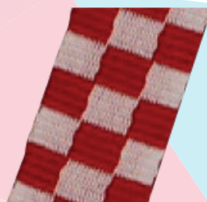
VRPCA CRO ŠIRINA 2,2 cm