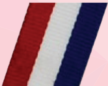
VRPCA R/W/BL ŠIRINA 2,2 cm