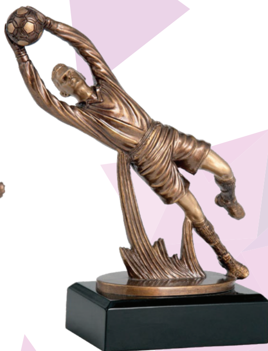
RFXR3137/BR VISINA 21 cm