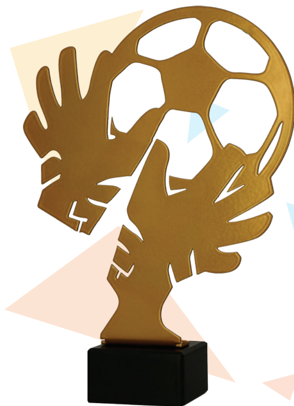
ML - SDC3