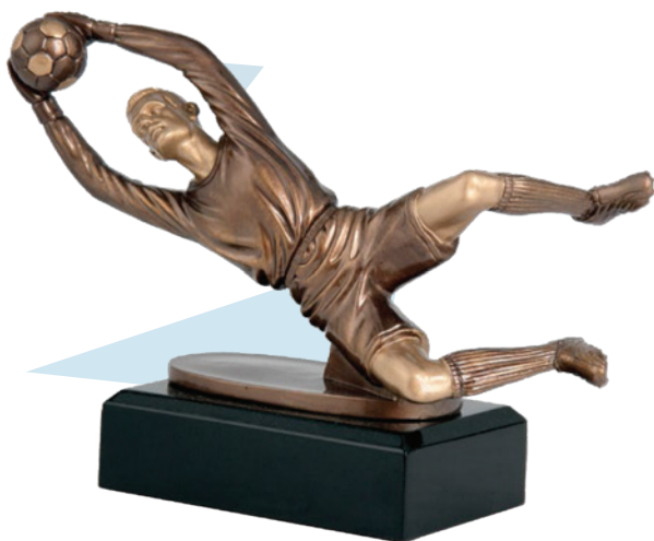
TPFR863/BR VISINA 15 cm