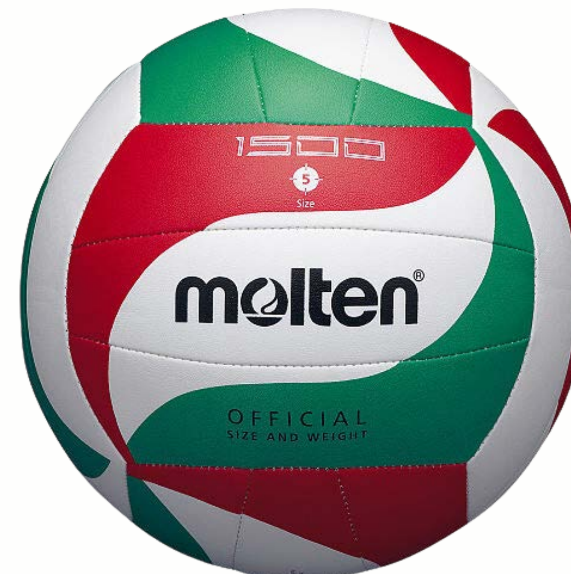
ODBOJKAŠKA VELIČINA 5