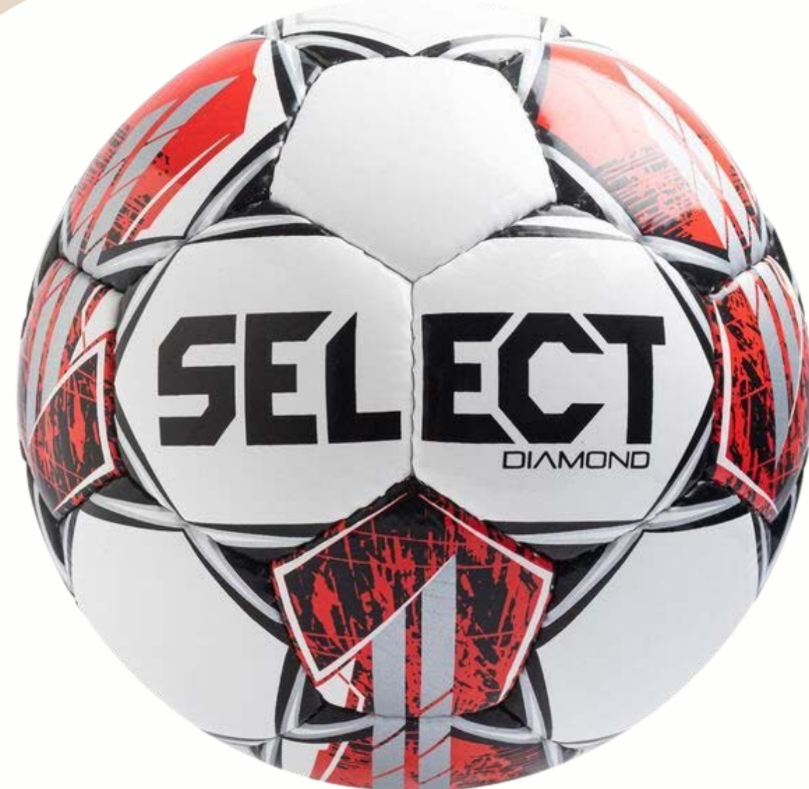
NOGOMETNA VELIČINA 5