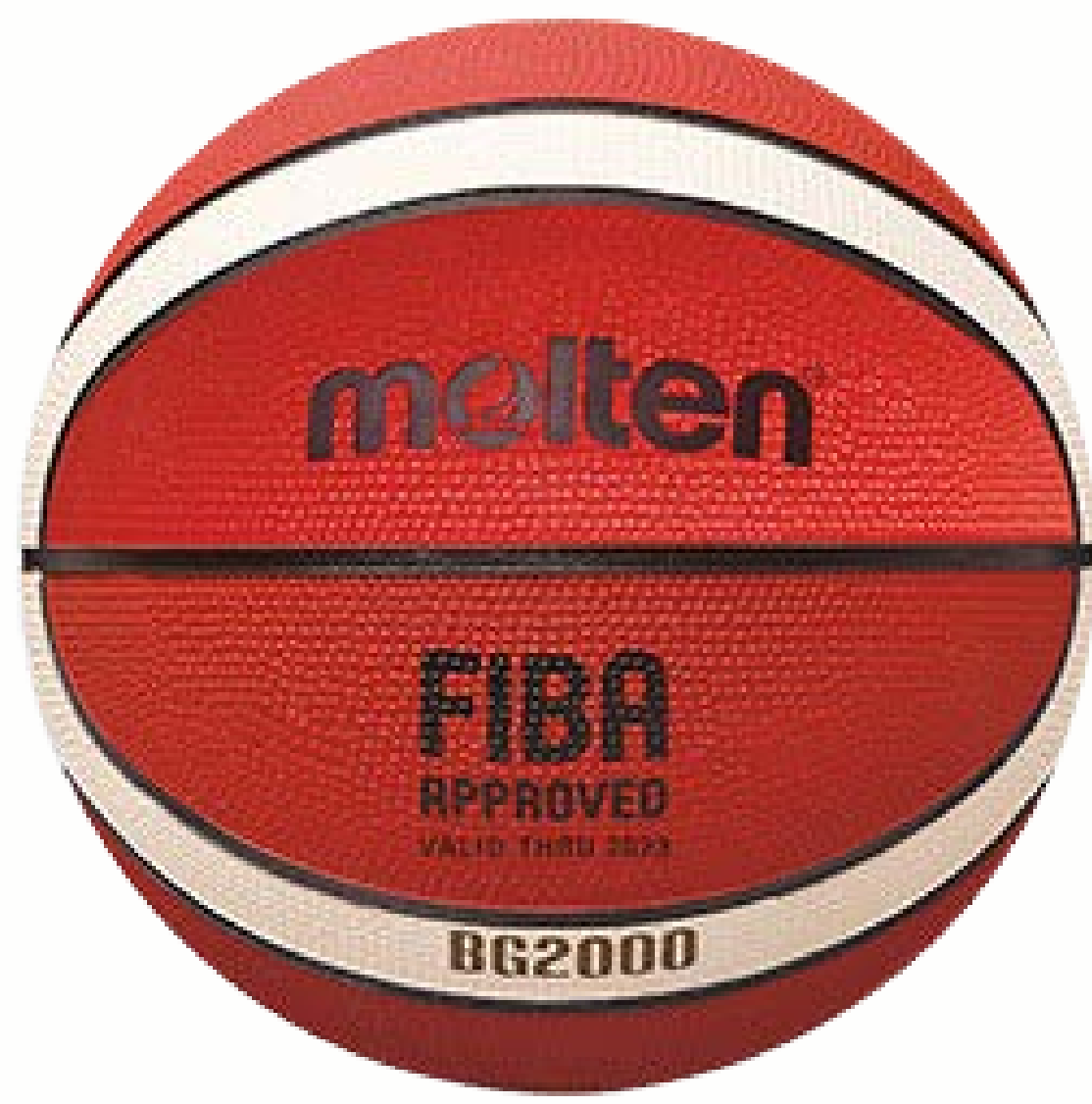
KOŠARKAŠKA VELIČINA 7